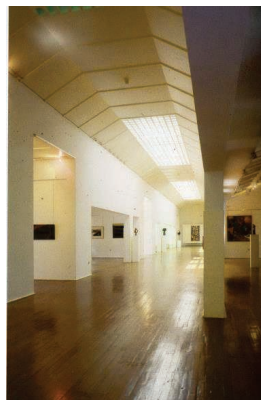
Museu Amadeu Souza-Cardoso