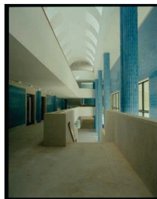
Câmara Municipal de Matosinhos ©Luis Ferreira Alves