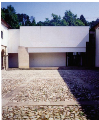
Pousada do Castelo