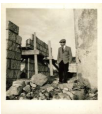
Figura Eminente U.PORTO 2013: Fernando Távora | novembro e dezembro

Para grupos organizados é obrigatória a inscrição prévia através de contacto telefónico (+351 22 5518557) ou email (fims@reit.up.pt).